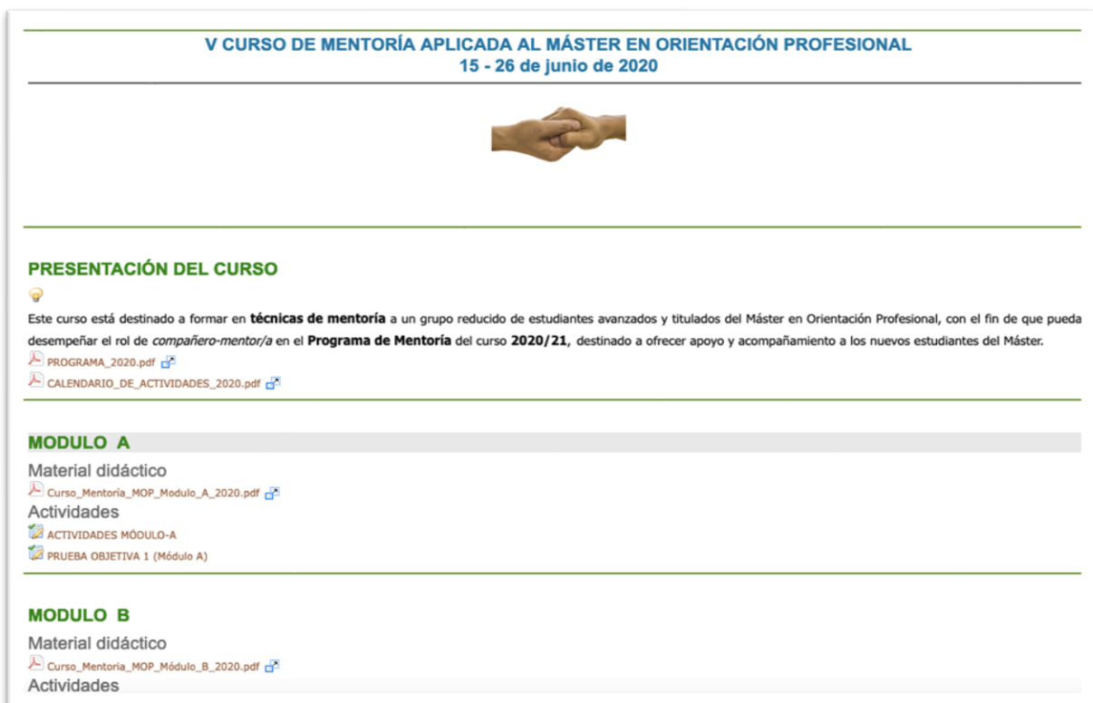
Figura 3. Espacio virtual V Curso de Mentoría aplicada al Máster en Orientación Profesional