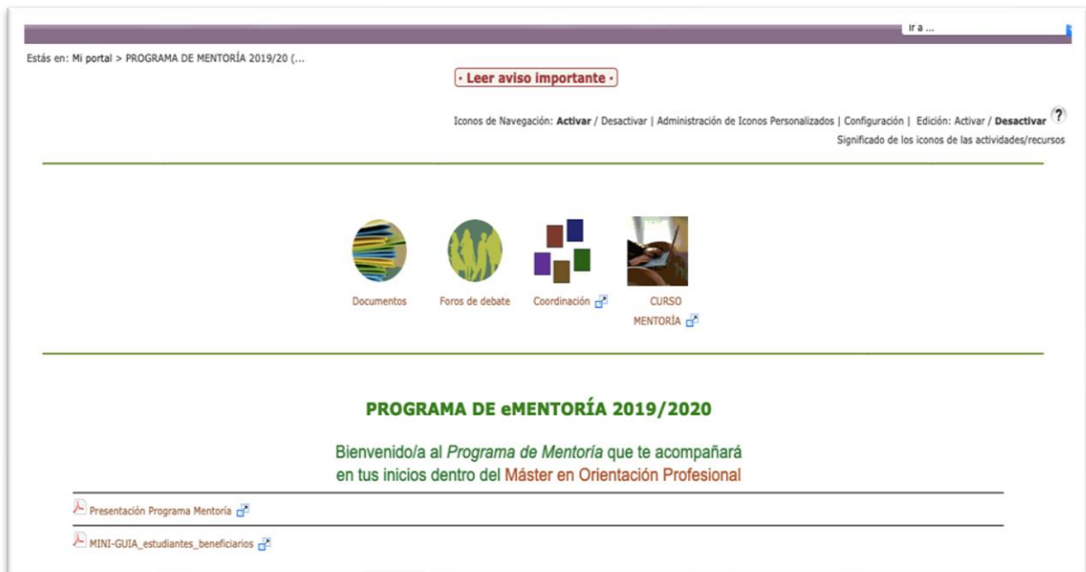
Figura 2. Plataforma virtual aLF del Programa de eMentoría