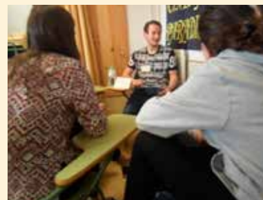
MAESTRO DE PRIMARIA