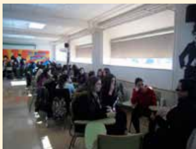
VISTA GENERAL DE LA SALA DE USOS MÚLTIPLES