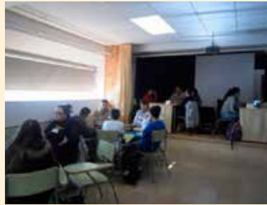
INTEGRADORA SOCIAL, SOCIÓLOGO...