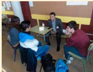
INGENIERO TÉCNICO INDUSTRIAL