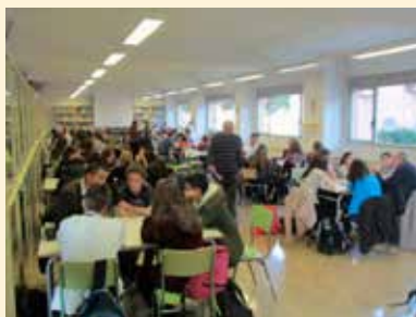
VISIÓN GENERAL DE LA SALA BIBLIOTECA