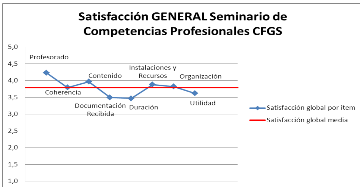
Gráfico 2. Resumen gráfico resultados generales Encuesta Satisfacción Seminario de Competencias Profesionales. 23 Marzo 2012