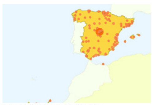
Este país/territorio ha enviado 13.989 visitas a través de 131 ciudades